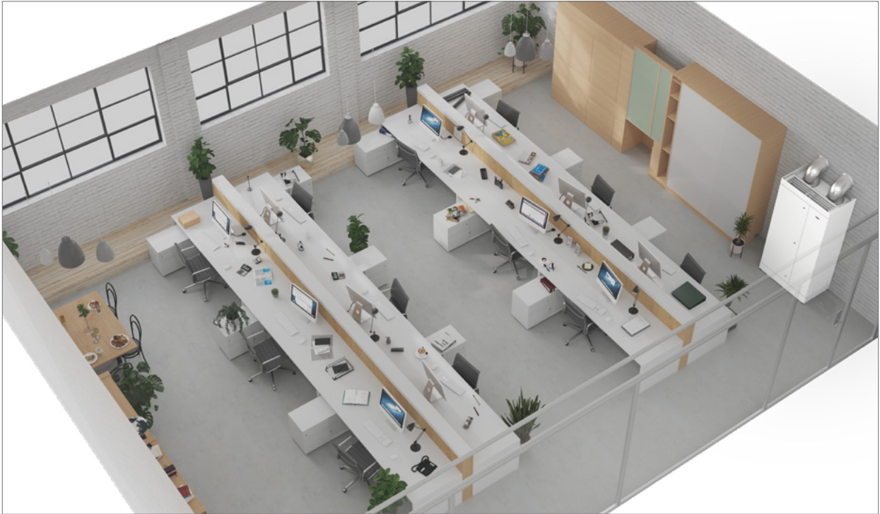
Referenzbeispiel RLT-Standgerät dezentral