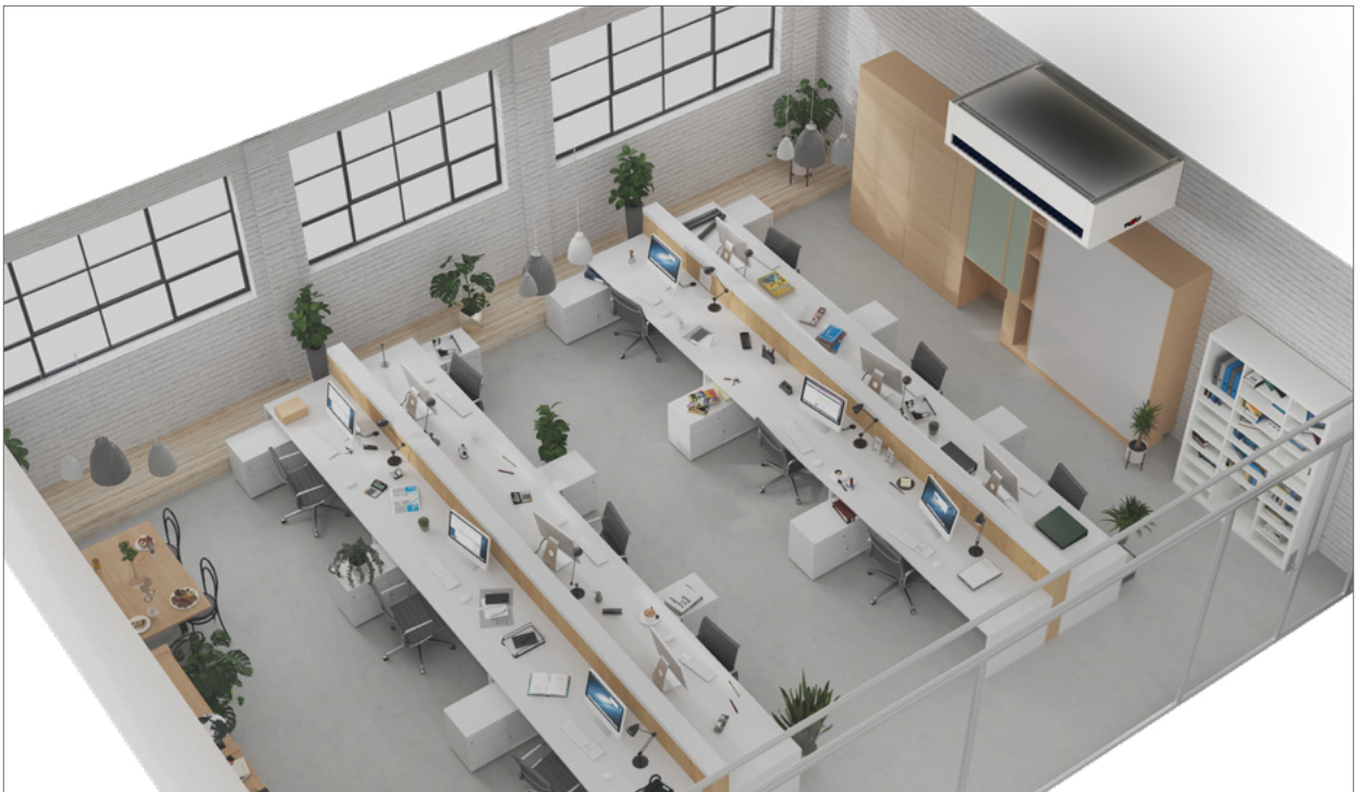
Referenzbeispiel RLT-Deckengerät dezentral