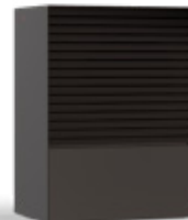
NERO (RAL 8019)