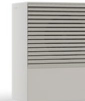
NEBBIA (RAL 9018)