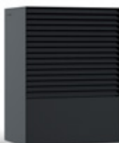
ANTHRACITE (RAL 7016)