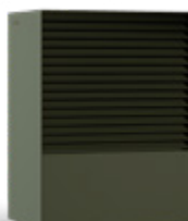
OLIO (RAL 6003)